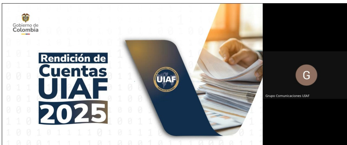
Evidencia de la transmisión del evento de diálogo.