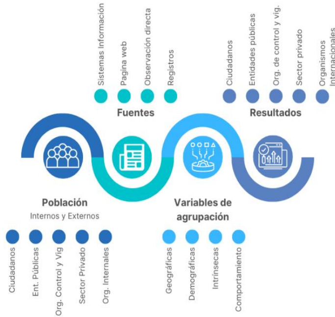
Ilustración 10. Caracterización de Usuarios

La caracterización de usuarios parte de un ejercicio realizado por la Oficina Asesora de Planeación 2 y fortalecido con el ejercicio de construcción del PETI realizado por todo el equipo de trabajo, tomando como base la guía para caracterización de usuarios del MINTIC y de la Dirección Nacional de Planeación. Se identificaron variables y grupos de interés objetivo para desarrollar los diferentes objetivos institucionales.