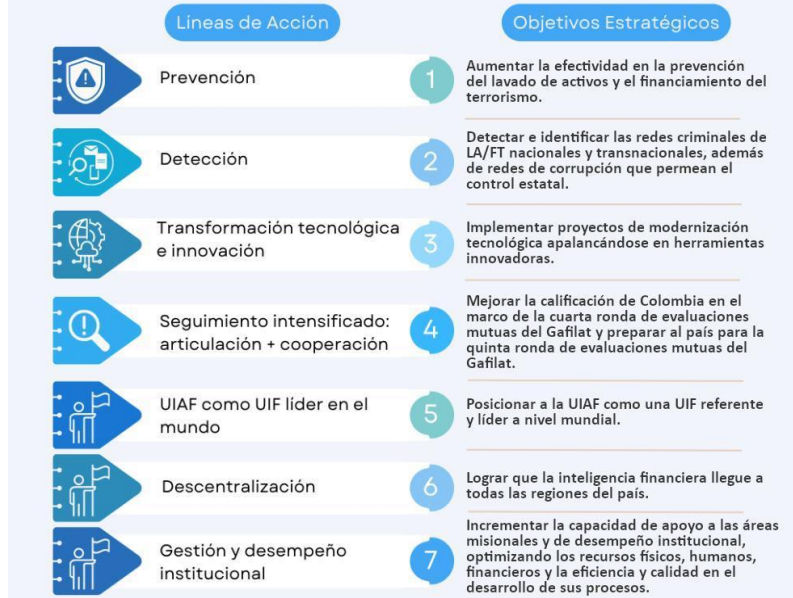
Ilustración 3. Líneas de acción y Objetivos Estratégicos

Cada objetivo estratégico cuenta con una serie de Estrategias y acciones o proyectos. El PEI se encuentra publicado en la página web de la UIAF www.uiaf.gov.co .