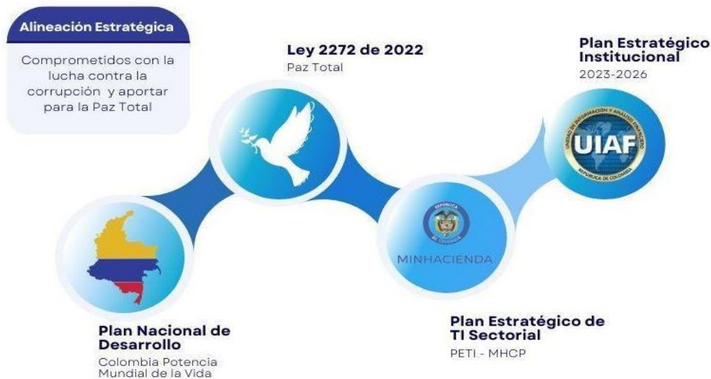
Ilustración 2. Alineación Estratégica

El PETI de la UIAF se encuentra desarrollado de acuerdo con los lineamientos definidos por el gobierno nacional y por la alta dirección de la entidad. A continuación, se visualizan los principales referentes considerados que posibilitan una alineación estratégica entre el direccionamiento estratégico de la entidad en optimización de recursos y servicios de TI, con los referentes nacionales.