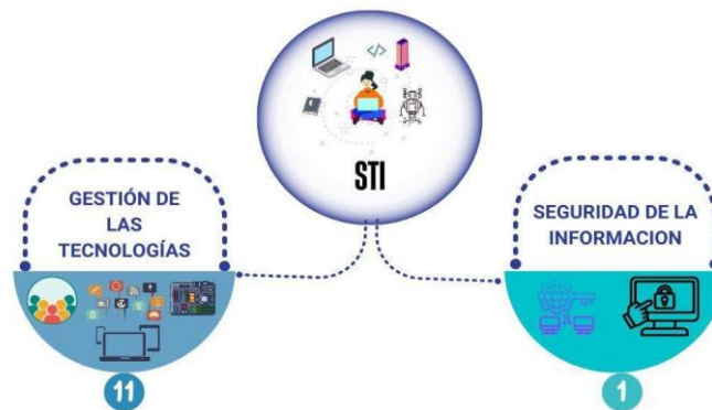
Ilustración 9. Procesos de la subdirección de TI

La subdirección cuenta con doce procedimientos que apoyan la gestión de TI, los cuales incluyen gestión de accesos, usuarios, aplicaciones, redes, infraestructura, comunicaciones y seguridad: