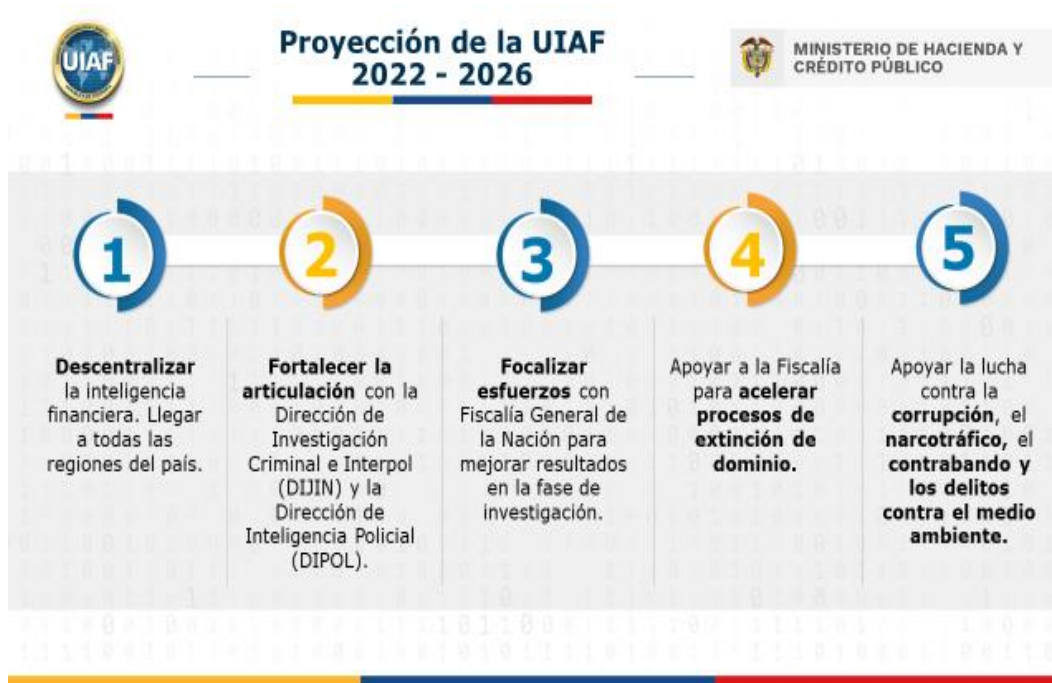
Ilustración 5. Pilares