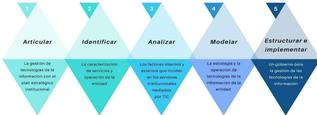
Ilustración 1. Objetivos Específicos