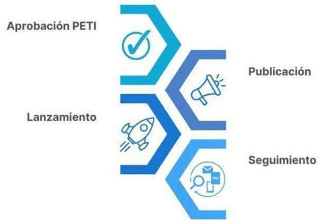
Ilustración 16. Plan de comunicaciones